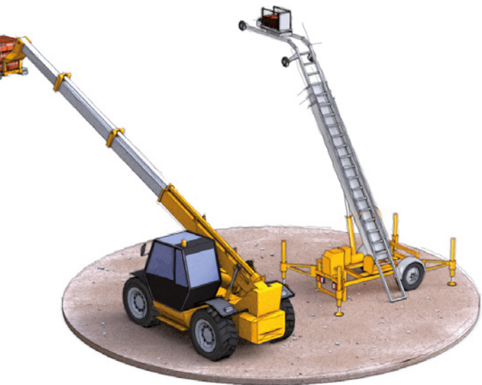
Engins de manutention